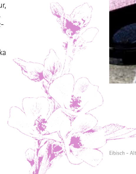
Eibisch – Althaea officinalis

Bei der Entwicklung der Serie arbeiteten Dr.Hauschka Naturkosmetikerinnen zusammen mit Künstlern an der Farbgestaltung. Das Ergebnis ist einzigartig: Die Dr.Hauschka Farbtöne besitzen ihr Eigenleben und entfalten auf jeder Haut eine ganz eigene Nuance.