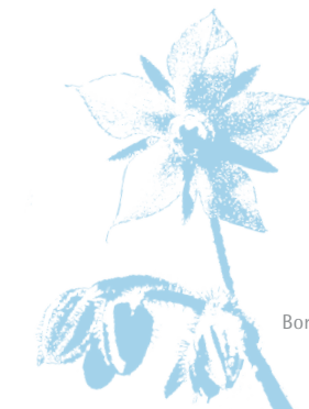
Borretsch – Borago officinalis