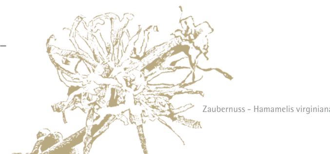
Zaubernuss – Hamamelis virginiana

Bei dieser Behandlung bekommt die Haut am Rücken genau die Zuwendung, die sie benötigt. Dank einer intensiven Reinigung und gezielter Pflege wird sie wunderbar belebt und fühlt sich sanft an – für einen Rücken, der sich sehen lassen kann.