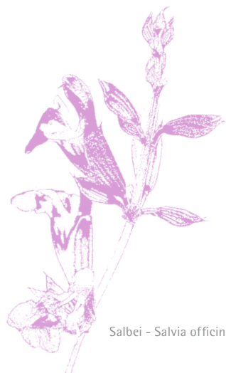
Salbei - Salvia officinalis

Die Klassische Dr.Hauschka Behandlung führt zu tiefer Entspannung und hinterlässt ein Gefühl des Durchströmtseins, ein Gefühl von Licht, Leichtigkeit und innerer Balance.