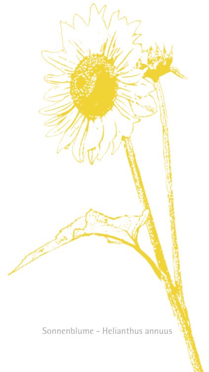
Sonnenblume – Helianthus annuus